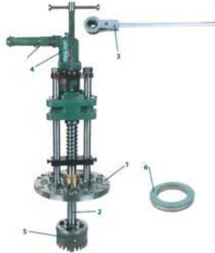
2. sz. ábra