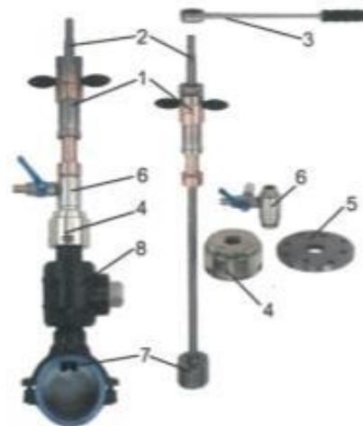
4. sz. ábra

A készülék nyomás alatti PE anyagú gázelosztó vezetékek megfúrására max. 10 bar üzemi nyomásig alkalmazható!