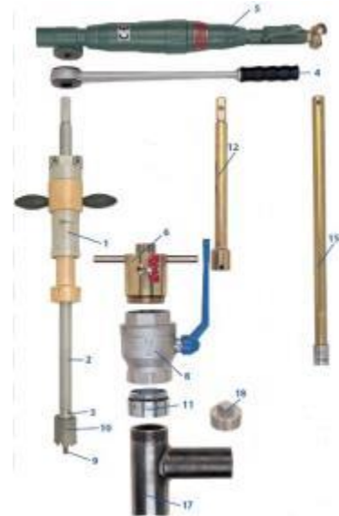
1. sz. ábra